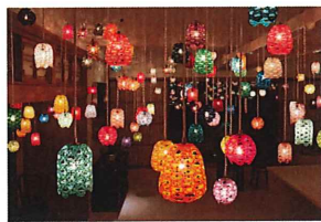
自遊花人水引ミュージアム