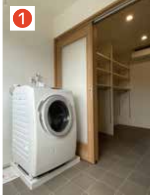
ドライクローク横がファミリークローゼットなので乾いたら即収納♪