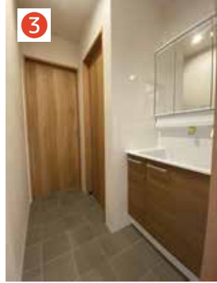
洗面所と脱衣所を分けることで入浴時に重なることなく使用可能。

毎日の家事をスムーズにこなせるように工夫した家事ラク動線のお家へとお手伝いさせて頂きました♪