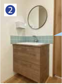
外から帰ったら直ぐ使える洗面所。