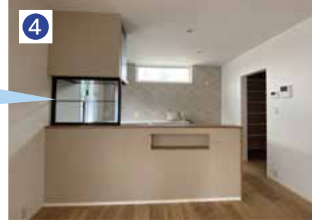
家族の様子が見えるようにガラスを設置。格子はガラスの中に入っているので拭き掃除も楽ちゃん!!

乾いた洗濯物をドライクロークからそのまま大容量のファミリークローゼットに片付けることができます。