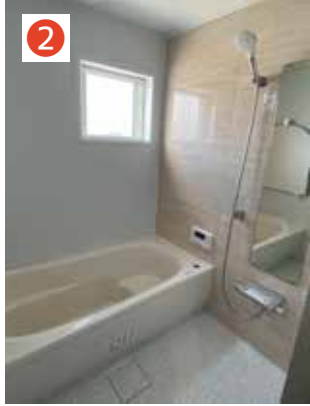
お風呂はパントリーの上にあるので、音を気にすることなく入浴可!!