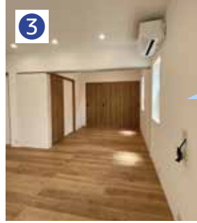
リビング併設の部屋は床を繋げて広々と。