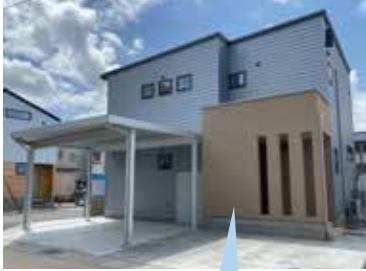
外から中が見えない玄関。自転車も雨に濡れずに収納可能♪

買い物をして帰ってきたら、玄関収納→パントリー→キッチンと片付けながら家に入ることができます。