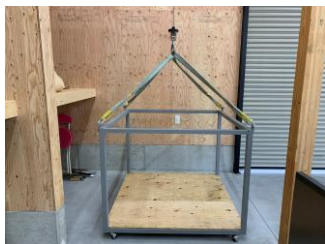
小荷物専用昇降機