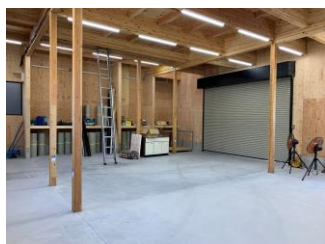
加工場・資材置き場