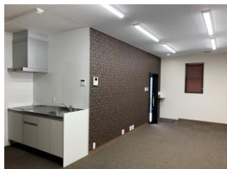
事務所とミニキッチン