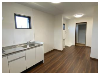
2階は外国人技能実習生の寮になっています