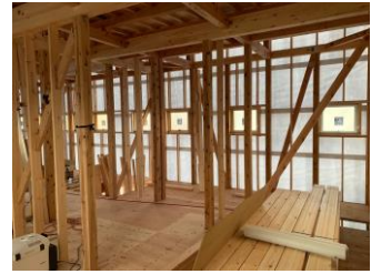
木造2階建てアパートです