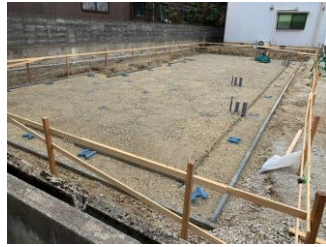
解体後一旦更地に