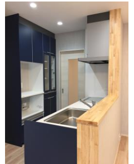
シックな紺色のキッチン