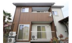
南側から見た外観