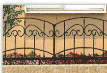
鋳物形成フェンス