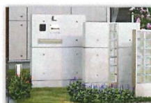
コンクリート&ブロック塀

打放しはクールでモダンな印象。レンガやタイル張り・天然石張りの他、吹きつけや塗り壁などのアレンジも豊富で印象も様々