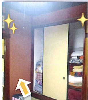
ダブル筋交いを入れた耐力壁