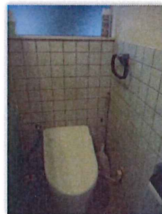
タイルの壁も補強して クロス張りの壁に変更 手すりも取付け温かい快適なトイレに変わりました