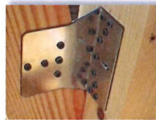
ダブル筋交いを入れ、筋交い金物で補強