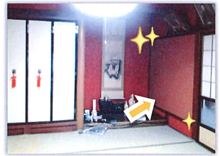
床の間の横は強い壁(耐力壁)になり 耐震強度がアップ！