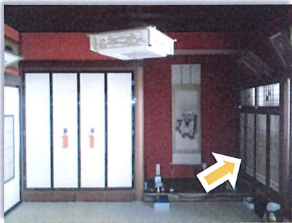
床の間の横の書院障子を 壁面に変更します