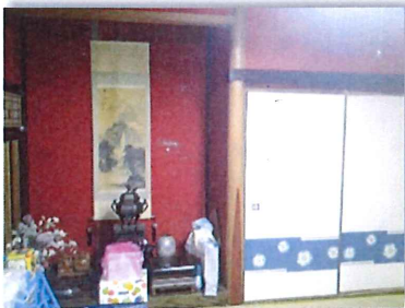
隣の和室も同じように 書院障子は壁面にして こちらの床の間は押し入れに変更