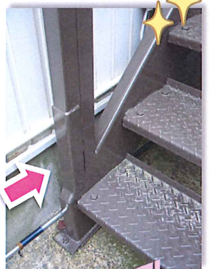
穴を埋めて鉄板補強し、 錆び止め塗装を塗りました