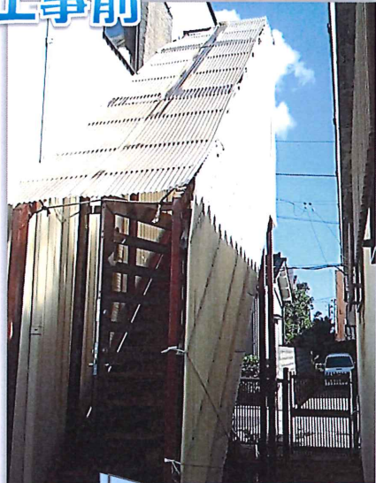
テナントビルの非常階段です