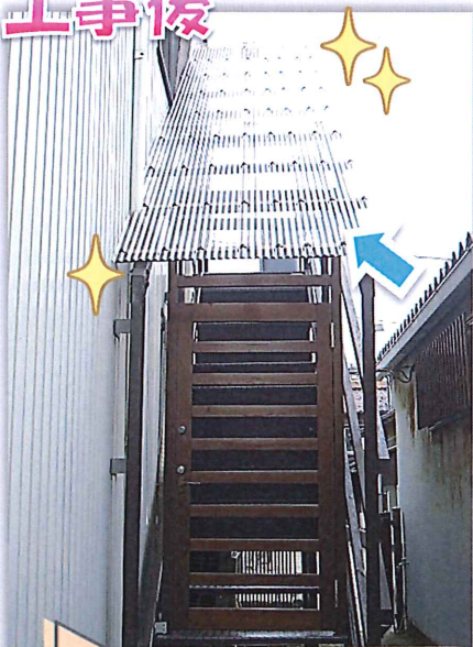
クリアタイプの ポリカーボネート製波板に 張り替えました 明るさも耐久性もアップ!