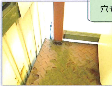
所々、腐食し 穴も空いてきています

満3か月から小学3年生までを 対象とした高度託児教育施設です。 (全国に8か所あります) 金沢市長田 2-26-11 TEL 076-229-7757