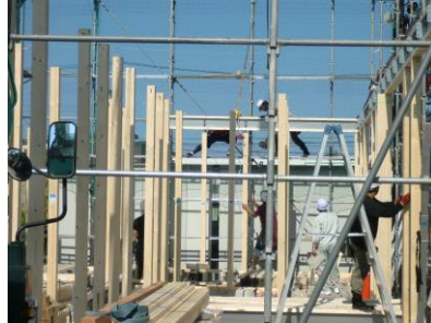
建前 (テクノストラクチャー工法)