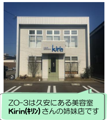
ZO-3は久安にある美容室 Kirin(キリン)さんの姉妹店です